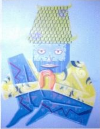
Donny Subastian Praying To God Acrylic On Canvas. 120x100 2013