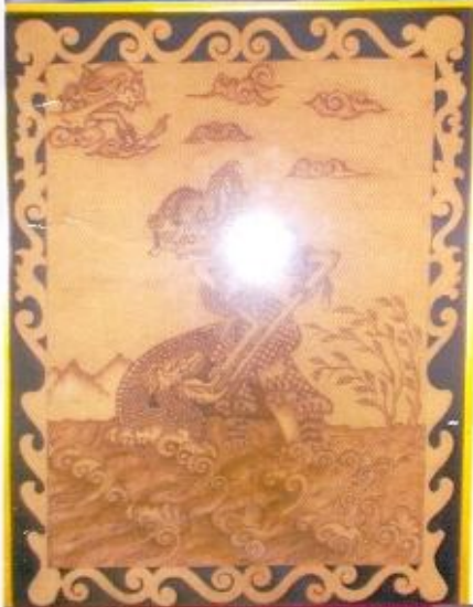
Abdul Rouf Dewa Ruci Kulit Nabati Solder Dan Pahat 2013