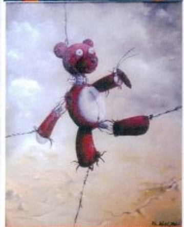
Razi fardiansyah The Doll 40x50 Cm Oil On Canvas 2013