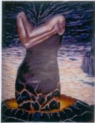
Khoirul Anwar Magma Dalam Wanita Acrylic On Canvas 180x120cm 2013