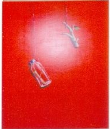
Terkurung Dan Tergantung Ruci Santoso Acrylic On Canvas 100x120 Cm