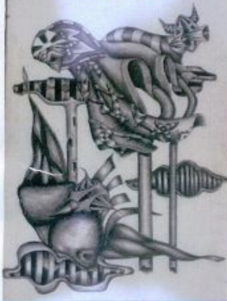
Ahsin Thohari Several Species Of Imagination A3 Pencil On Paper 2013