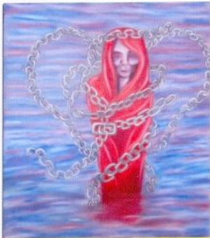
Eastya W Terjerat Oil On Canvas 100x80 Cm 2014