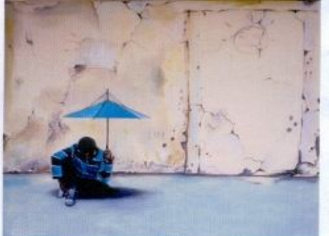
Angga Prasetyo Terusik Acrylic On Canvas 80 x 140