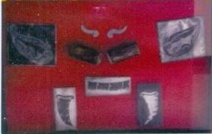
Kodaryadi Dan Ikwan Buta Cina Logam 2013