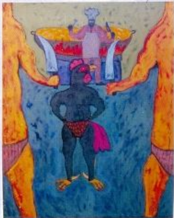
Veri Widiyanto Tak Gentar Sedikitpun 110x120cm 2013 Oil On Canvas