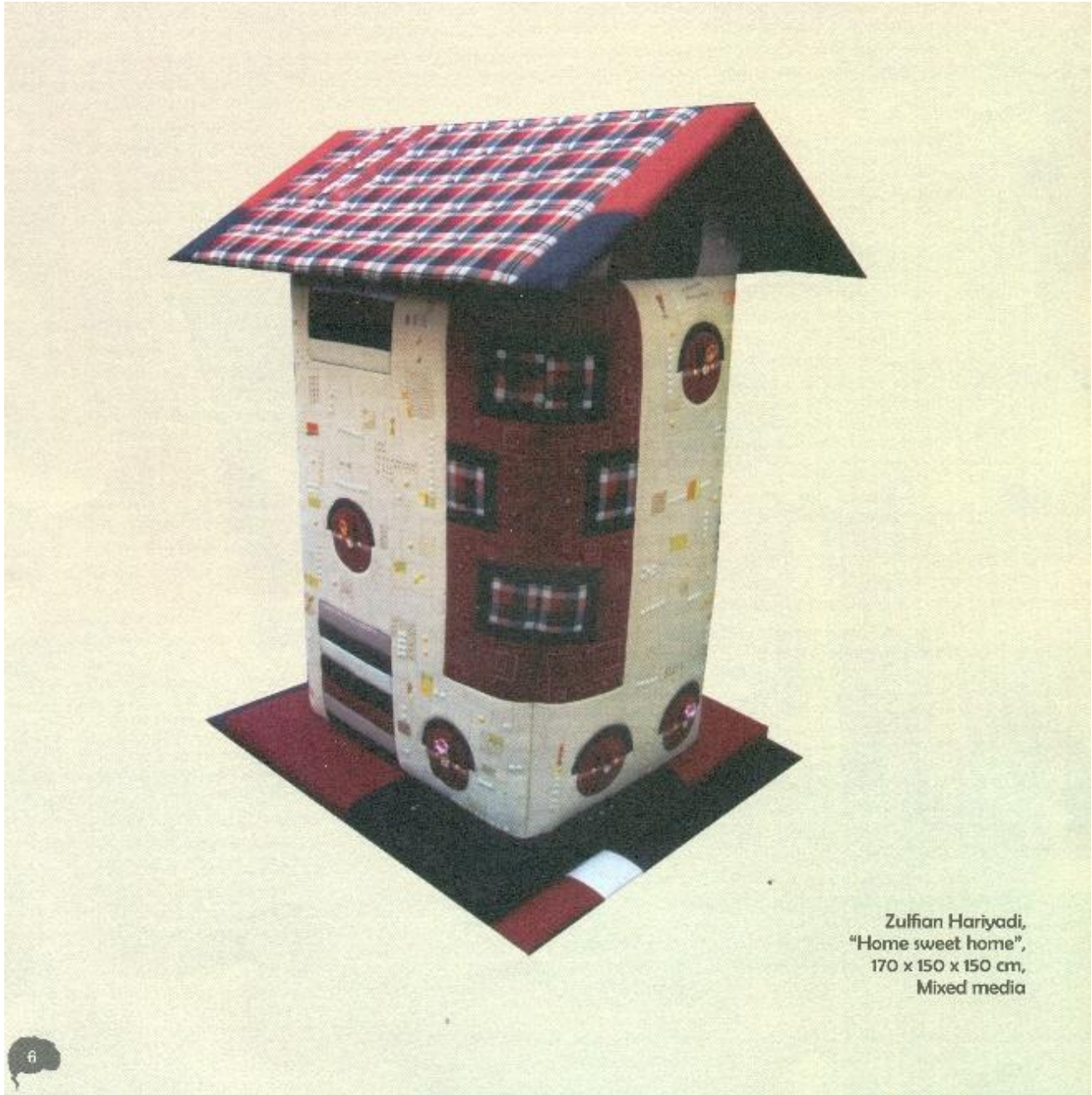
Zulfian Hariyadi, "Home sweet home", 170 x 150 x 150 cm, Mixed media