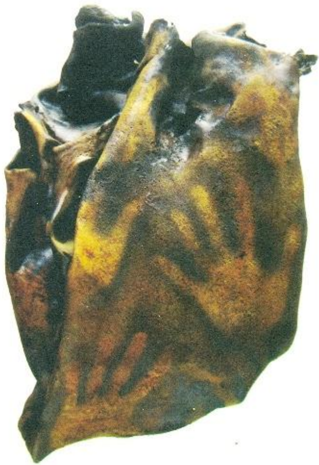
Toni, "Galur", 100 x 70 cm, leather, 2014