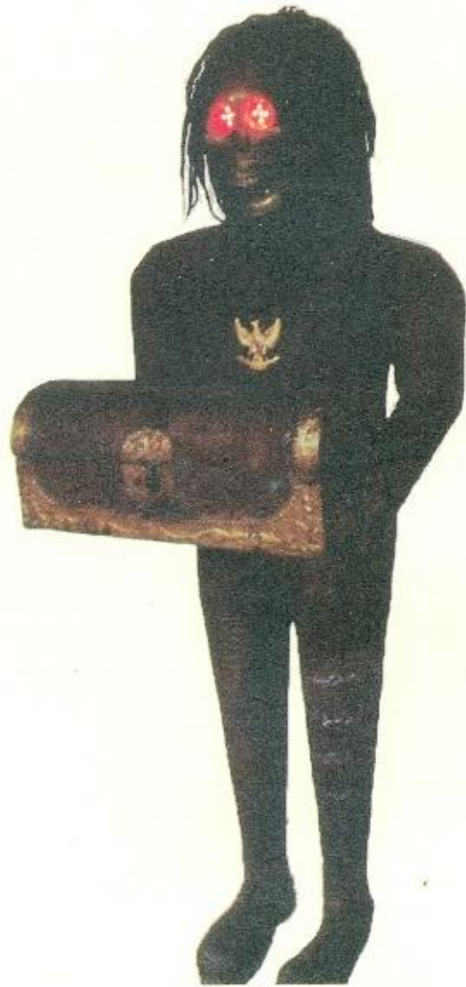
Sigit Pamungkas, "Power of naga sasra", 170x60x50, mixed media, 2014