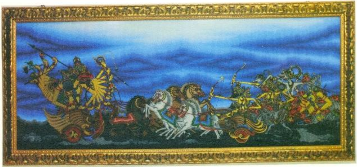
Kholim, "Rahwana Gugur", 180 x 70 cm, Cat dan Kaca, 2014