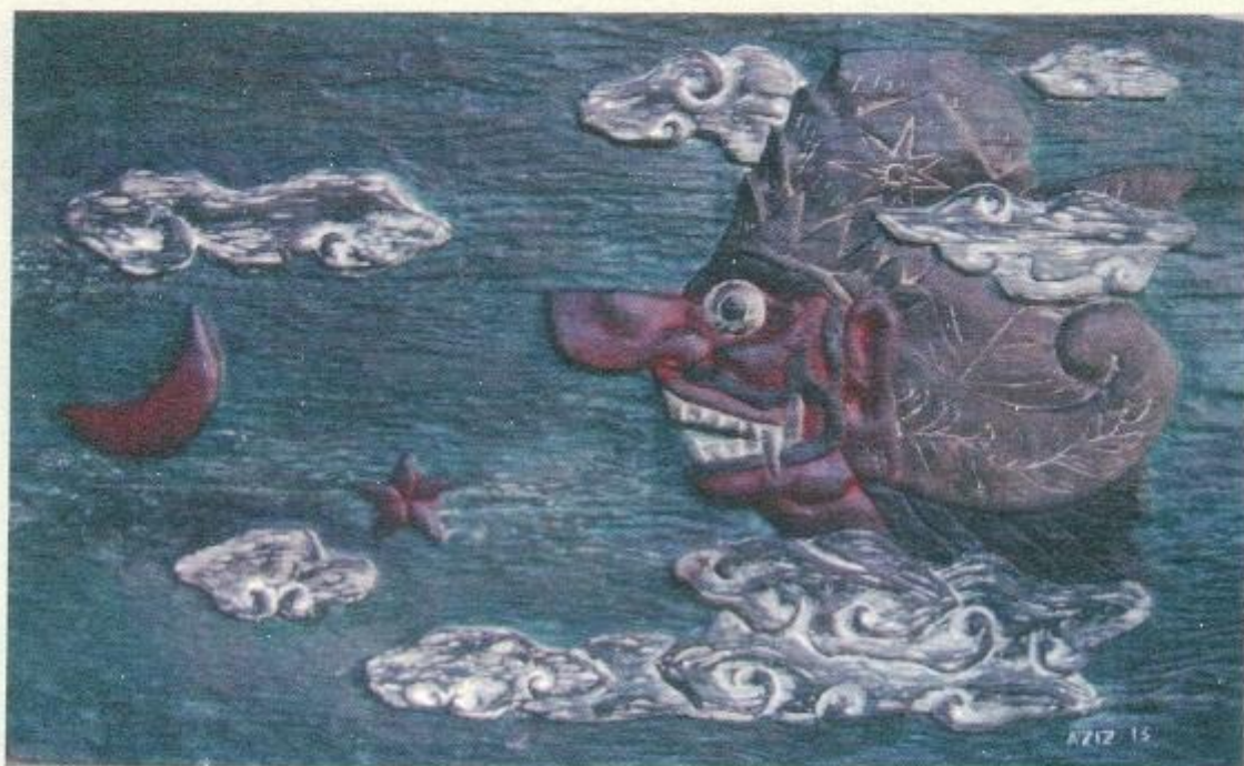
Abdul Aziz, "Kumbakarno", Gugur-kayu pinus, 130 x 80 x 4 cm, 2013