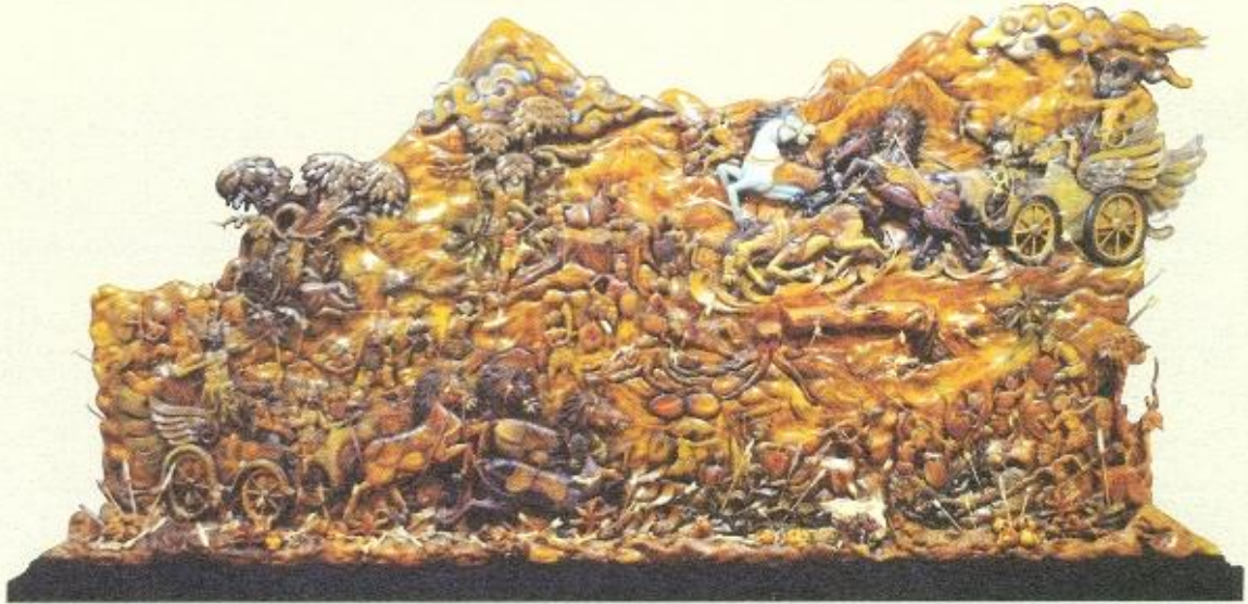
Rudi, "Karna Tandling", mix media, 135 x 300 x 20 cm, 2014