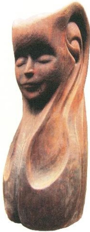
Joko, "Pendengar", 21 x 22 x 58cm, Kayu