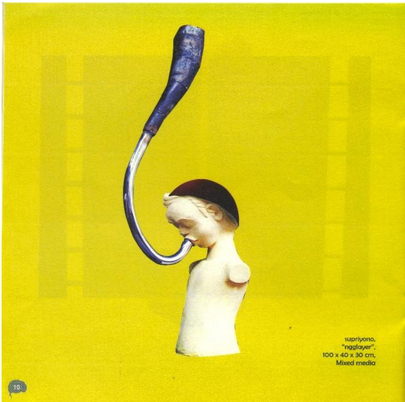
supriyono, "ngglayer", 100 x 40 x 30 cm, Mixed media