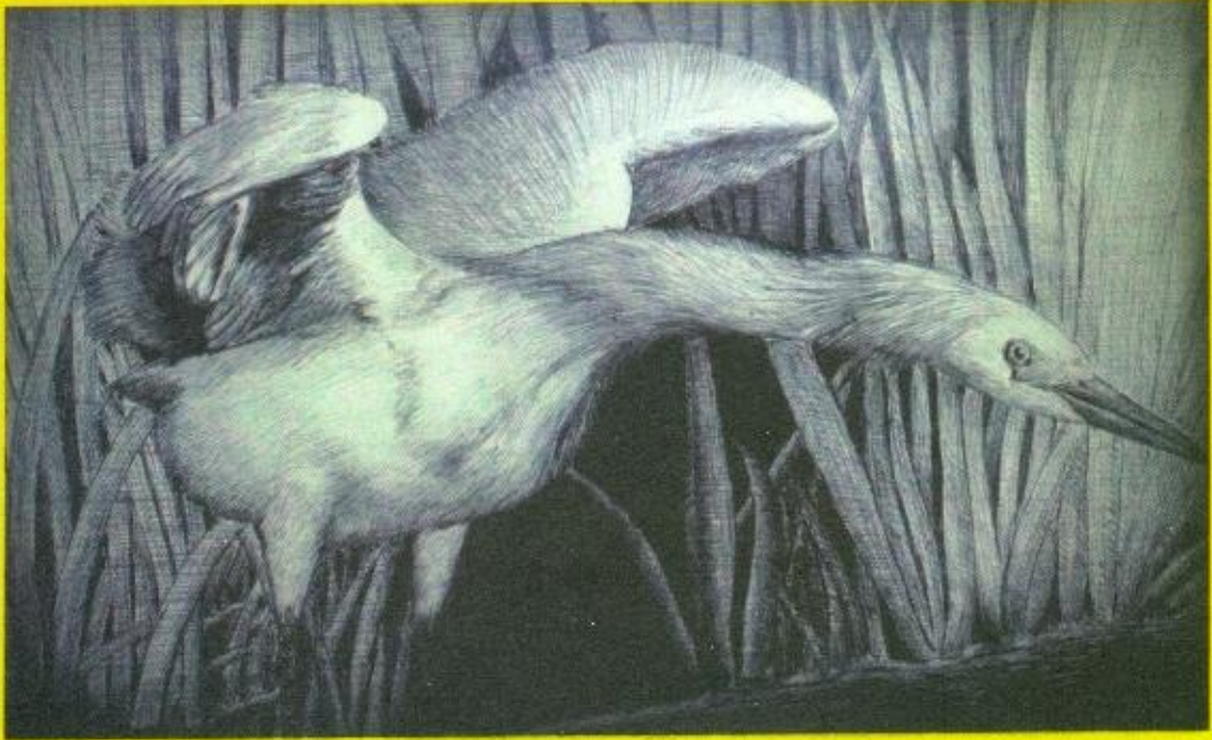
Grompol Sunarwan, ink on paper,