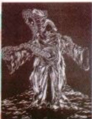
Ricky Prayudi "Of The Soul" Hardboard Cut on Paper 30cm x 40cm