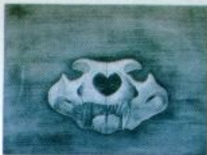
Erwin Saputra "Is This Togetherness...?" Mix Media on Canvas 75.5cm x 65.5cm