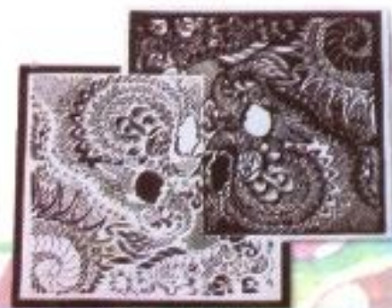
M. Abdul Kodir "Contrast Soul" Paper Cut 48cm x 41cm