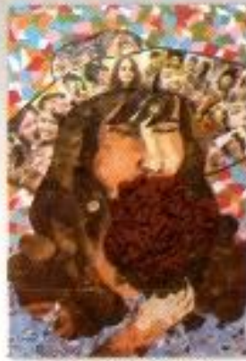
Brigita Kristia P. B. "Wanita Pembawa Bunga" Mix Media on Board 40cm x 80cm