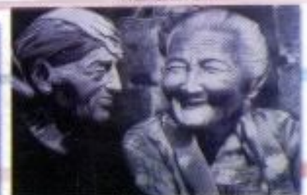
Dustaf Arrum Harata "Kakek dan Nenek" Pencil on Paper 40cm x 30cm