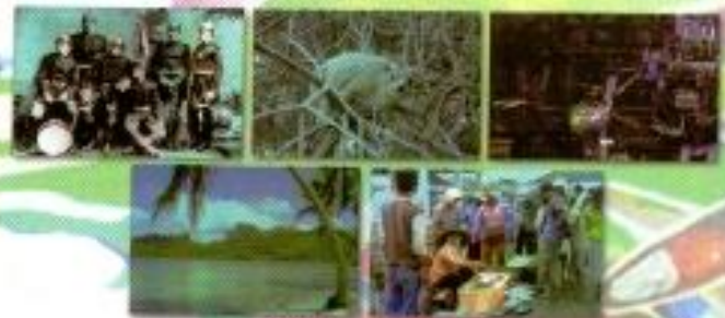
Muhammad Reza "Coba Deh Liat Pake Kecamata 3D, Ada Bedanya Gs" Digital Printing 30cm x 21cm x 7 panel