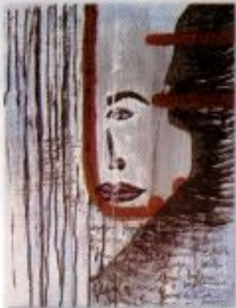
Kurnia Kusuma "Matamu Bercerita" Acrylic on Paper 80cm x 80cm