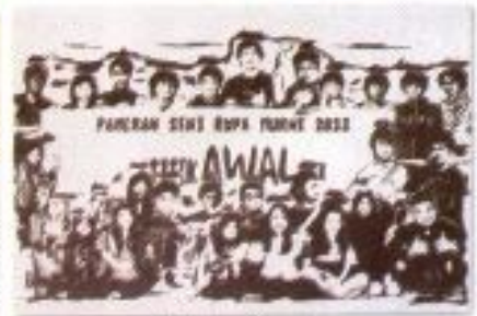
Zakarias Fariury "1000 Langkah Kecil SRM UNS" Pen on Paper 80cm x 40cm