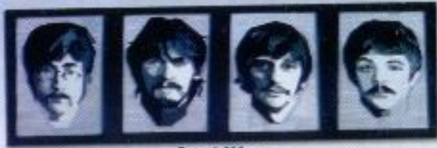
Faisal Akbar "Just Beatles" Mix Media 120cm x 40cm