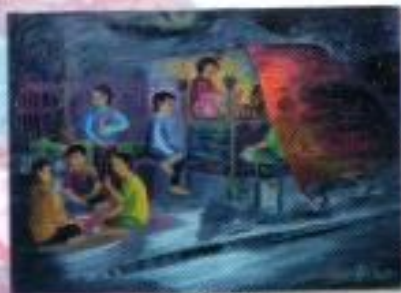
Prihoni Pratiwi "Nongkrong Bareng" Oil on Canvas 90cm x 70cm