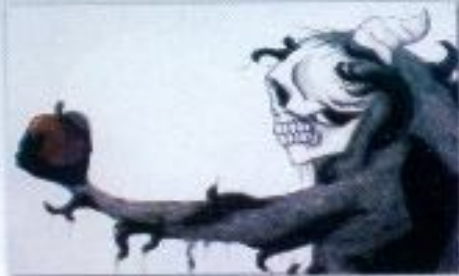
Dimas Arya Gutama "Present" Mix Media on Paper 50cm x 70cm x 2 panel