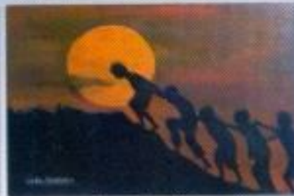
Cepy Pradikta "The Best Friend" Acrylic on Canvas 80cm x 80cm