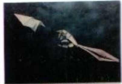
Razi Fardiansyah "Menggapai" Oil on Canvas 80cm x 60cm