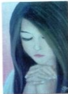
Hapsari Fadila "Wish You Were Here" Oil on Canvas 30cm x 40cm