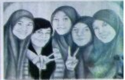
Mihwida Iwisa "Kasihmu Abadi" Mix Media on Paper 80cm x 40cm