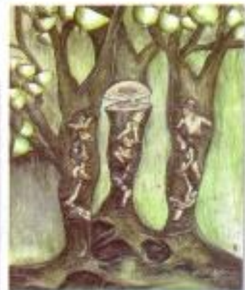
Erri Setyawan "Serentak Dalam Perbedaan" Acrylic on Canvas 70cm x 80cm