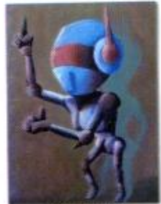
Yudi Prabowo "Tidak Jujur" Acrylic on Canvas 50cm x 80cm