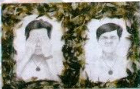
Ahmad Hadi Nur Cahya "Tak Pandang Bulu" Mix Media on Paper 80cm x 40cm