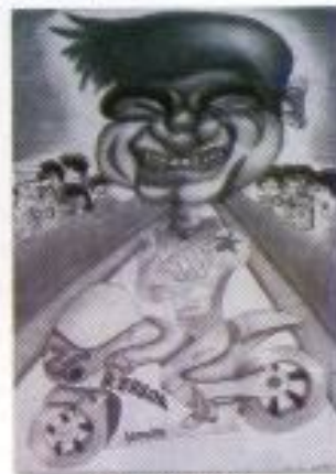
Putri Dintyesti "Pilota" Pencil on Paper 40cm x 80cm