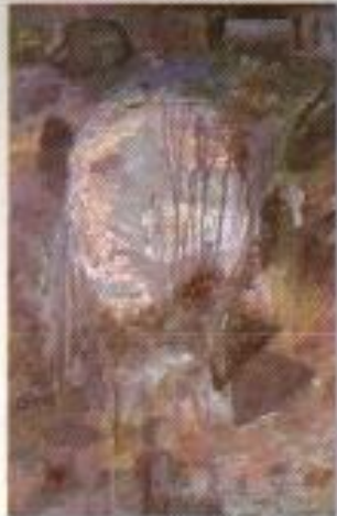
Dery Pratama P. "Mei Kelabu" Acrylic on Canvas 50cm x 80cm