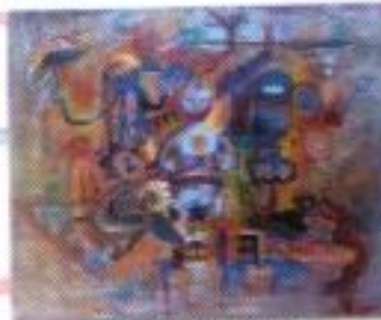
Undang Adi Surya "Aku Bersama Imaji" Mix Media on Canvas 70cm x 50cm