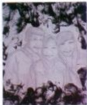
Beauty Dwi S. "A Smile for Ued" Mix Media on Paper 58cm x 72cm