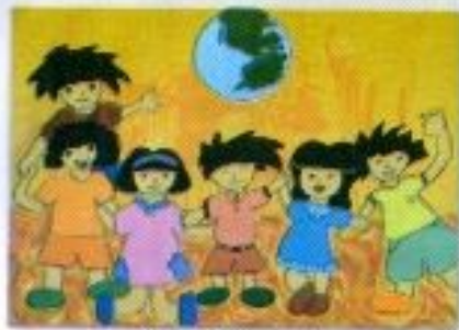
Arimbi Yaniarizky "Fight!!!" Mix Media on Canvas 80cm x 60cm