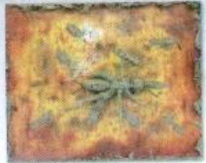
Rizal Erwin Hardikneta "Yang Barang Emang Lebih Enak" Mix Media 60cm x 50cm