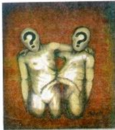
Zuhilmi Handeng Pratama "Keterikatan, Keterkaitan" Oil on Canvas 50cm x 80cm