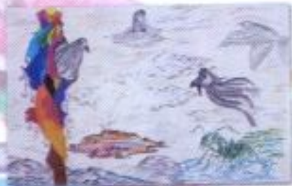
Fa'id D. B. S. "Teman Tak Pernah Sama" Mix Media on Paper 52cm x 34cm