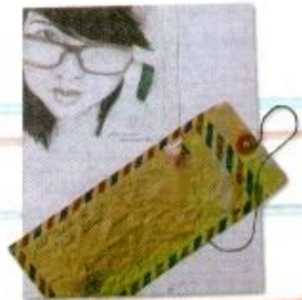
Moh. Fathurrohman "Merindukan Sosokmu" Mix Media 40cm x 50cm