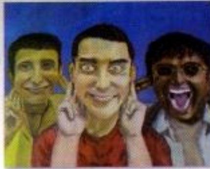
M. Jundi Al Furqan "3 Idiot" Oil on Canvas 60cm x 50cm