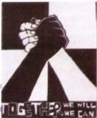
Nurri Nur Khananah "Difference" Paper Cut 40cm x 60cm