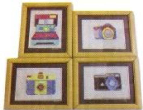
Deya Ayu Defrilia "Kamera" Sewing on Plastic Canvas 21cm x 21cm x 4 panel