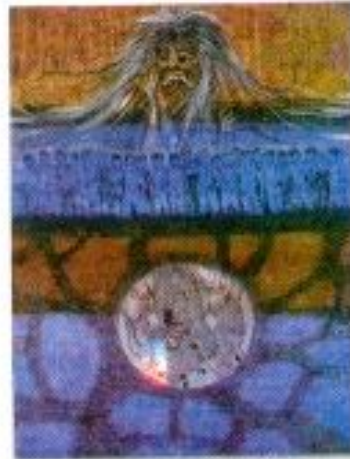
Samsul Agus S. N. "Munafik Galam Kebersamaan" Mix Media 70cm x 100cm