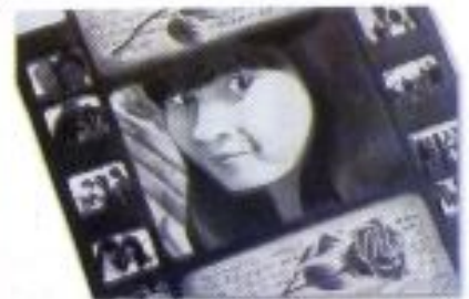
Farit Setiyanti "Memory" Mix Media on Paper 40cm x 30cm