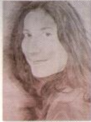
Danang Abdul Aziz "Senyum Hangat" Pencil on Paper 30cm x 40cm