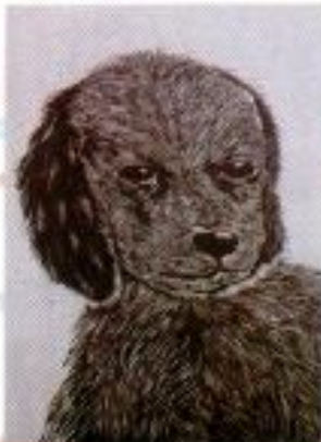
Bayu Widodo "Puppy" Hardboard Cut on Paper 30cm x 40cm