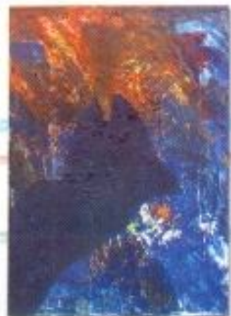
Fahmi Rahman "Naga" Acrylic on Canvas 50cm x 70cm