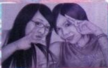
Lusiana Puspitasari "Best Friend" Pencil on Paper 80cm x 40cm