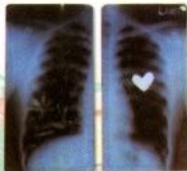
Julian Noval Dwi Wibisono "Setara" X-Ray Photography 35cm x 20cm x 2 panel