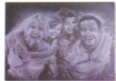
Angga Aditya "Kecewaan" Pencil on Paper 54cm x 40cm