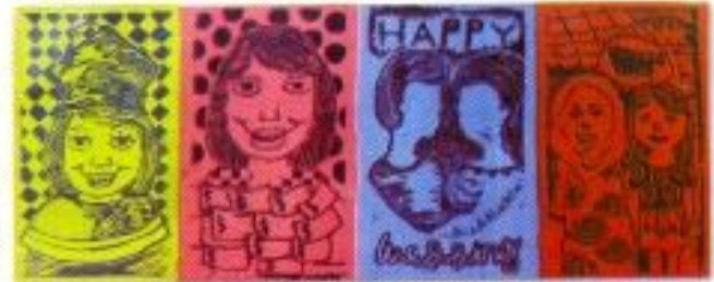
Sakinah Alatas "AMIN" Mix Media 35cm x 30cm