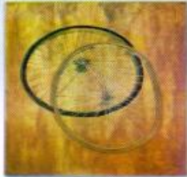
Adi Subaranta "Bersama Kita Kuat" Acrylic on Canvas 100cm x 100cm