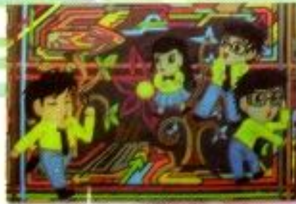
Martha Febrina Siagian "Kerinduanku" Acrylic on Canvas 70cm x 50cm