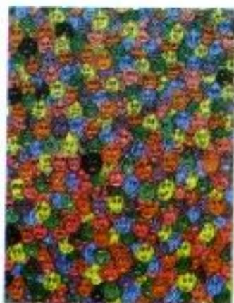
Leni Setiawati "Kehidupan Dalam Warna" Acrylic on Canvas 60cm x 80cm