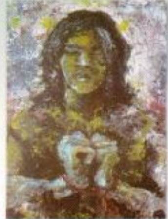
Ahmad Khoirun Nasikin "Tarekat" Acrylic on Paper 40cm x 80cm