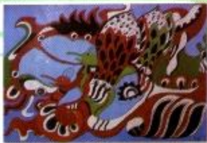
Agung Tri Kurwahyana "Ambias" Poster Color on Paper 60cm x 40cm