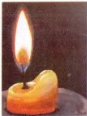
Den Akrom "Tertupakan" Acrylic on Paper 20cm x 28cm