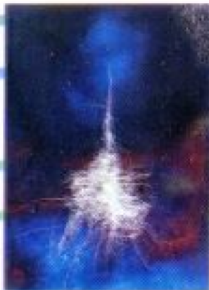
Handy Tevanda Rahman "Benturan" Mix Media on Canvas 40cm x 60cm