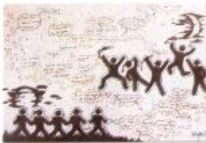
Mhd. Nursina Raayidin "Try To Move On, Fighting!!" Mix Media on Paper 70cm x 50cm