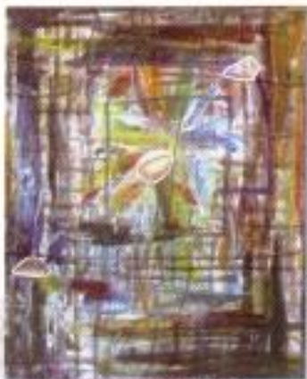
Perisman Nazara "Rumah" Mix Media on Paper 70cm x 90cm