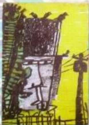
Bio Andaru "Melihat Kawan - Melihat Terang" Mix Media on Canvas 30cm x 40cm