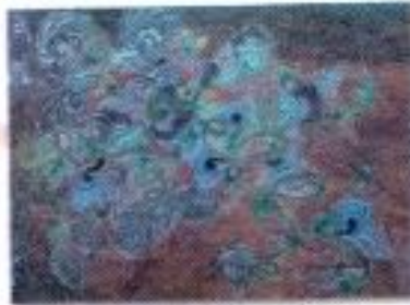
Immanuel Kasaneh "Mulai Bermekaran" Acrylic on Canvas 90cm x 70cm