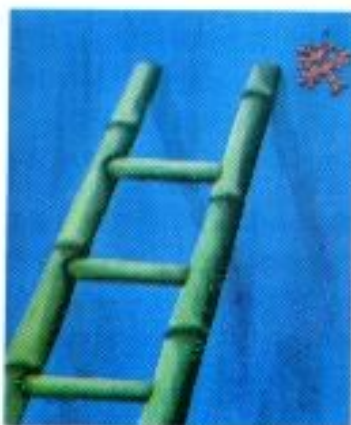
Dewi Jasmine "Balance" Acrylic on Canvas 70cm x 90cm