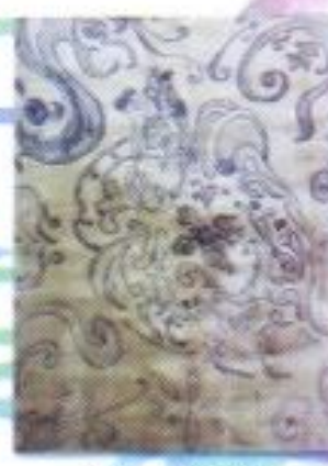
Purinta Nugroho "Berdetak Karena Ada" Mix Media on Paper 60cm x 88cm