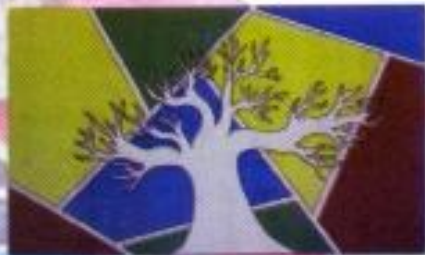
Mwydani Agil S. "Tersakit" Poster Color on Paper 40cm x 30cm