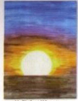
M. Bhifari Hikmatyar "A Sun" Pencil Color on Paper 30cm x 40cm