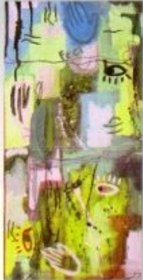
Oktavia Endah Purwaningrum "Liku-Liku Kehidupan" Mix Media on Canvas 30cm x 70cm