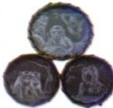
Bramandita Iqbal Noorcha "Nakari Binatang" Pencil on Paper 50cm x 50cm