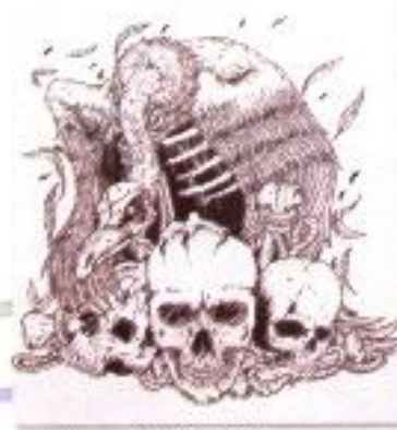
Arif Yulianto "Unstille" Pen on Paper 30cm x 40cm