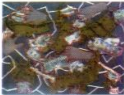
Dany Ramanda Putra "Jika Kita Bersama" Mix Media 100cm x 80cm