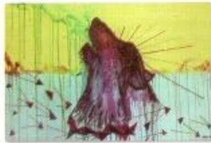
Amalia Permahani "Inside Me" Mix Media on Canvas 90cm x 70cm