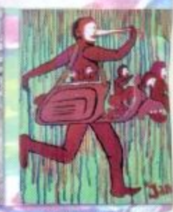
Janus Adha Saputra "Satu Tempat Sejuta Sahabat" Acrylic on Canvas 50cm x 60cm