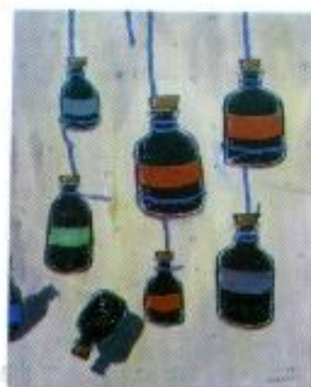
Damara Destrian "Battle of Euphoria" Acrylic on Canvas 80cm x 100cm