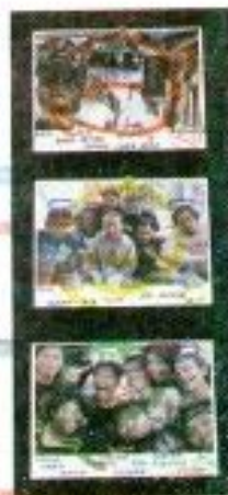
Hanifi Septamahtions "Fosofrianda" Mix Media 25cm x 45cm