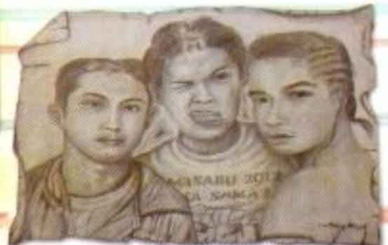
Galang Aldinur Masabi "Narsis" Pencil on Paper 40cm x 30cm