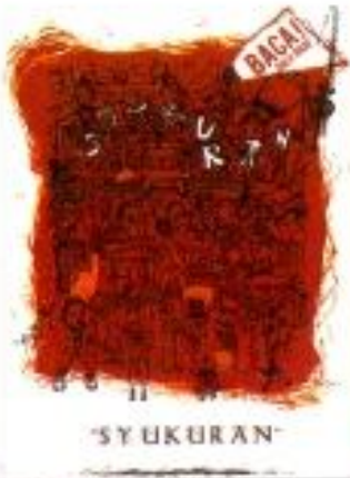
Chairunnisa Larsati Dewi "Syukuran" Digital Printing on Canvas 40cm x 60cm