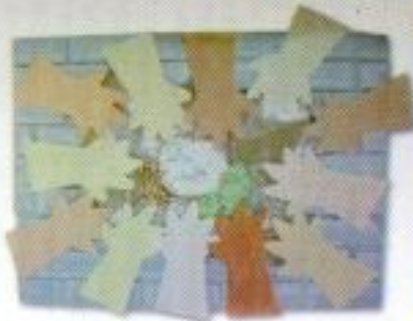
Iffah Nur Khalifah F. "Kawasan" Mix Media 66cm x 50cm