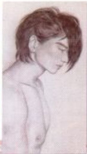
Sasmining .A. R. "Lonely" Pencil on Paper 21cm x 29cm