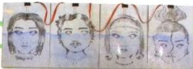
Hana Monika "Beda Tetapi Bersama" Mix Media on Paper 21cm x 30cm x 4 panel