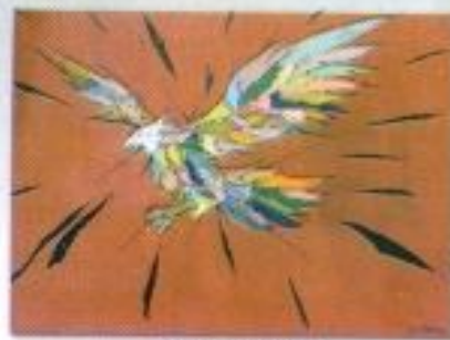
Syam Rusdi R. "Raja Cakrawala" Acrylic on Canvas 80cm x 60cm