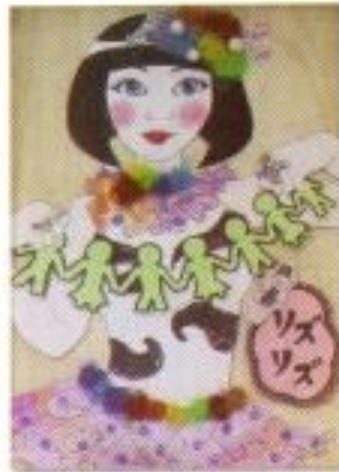
Rizka Nur Rachmania "The Doll" Mix Media 23cm x 33cm