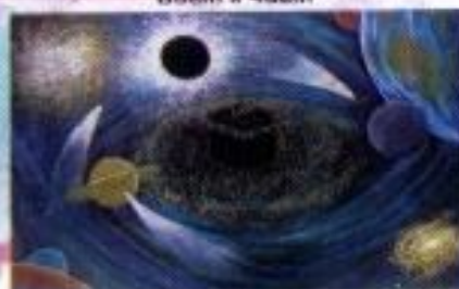
Oedy Kurniawan "Jagad Raya Bertasih" Mix Media on Paper 80cm x 40cm