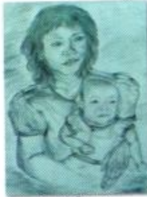
Endah Suryani "Bersama Ibu" Pencil on Paper 30cm x 40cm