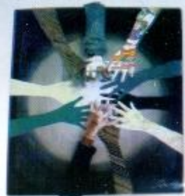
Rahmad Bayu Aji "Bersama" Mix Media 100cm x 87cm