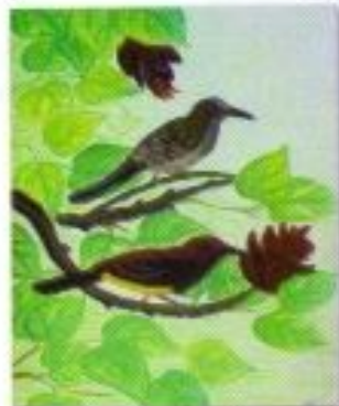
Ciaa Budytami "Myzomela Sanguinolenta" Mix Media 40cm x 80cm