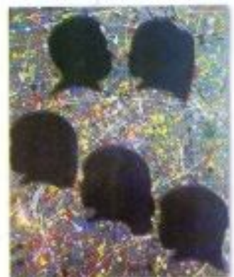
Davi Nurmalita "My Family My Everything" Poster Color on Paper 58cm x 72cm