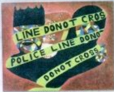
Juni Agus Rahman "Harta, Tahta dan Wanita" Acrylic on Canvas 50cm x 60cm