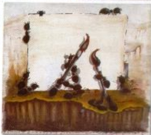
Pendidikan Seni Rupa "Kerajaan Kecil" Acrylic on Canvas 100cm x 100cm x 5 panel